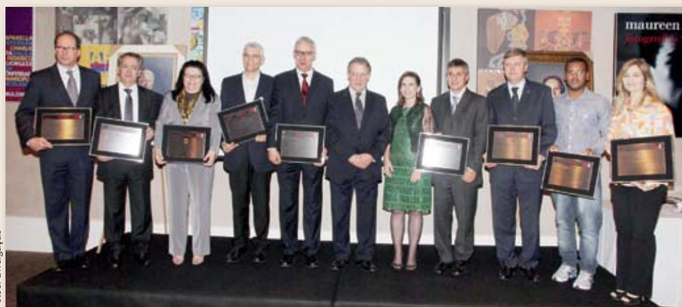
Concorrentes ao prêmio