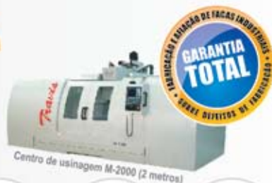
Centro de usinagem M-2000 (2 metros)

Qualidade, Custo Reduzido e Garantia Permanente